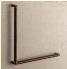
L型手すり 1本 8,500円～