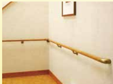
廊下用手すり 1本 18,000円～