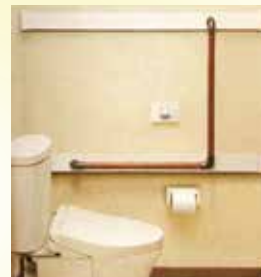
トイレ用手すり 1本 8,500円～