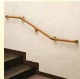
上がりかまち用手すり 1本 13,000円～